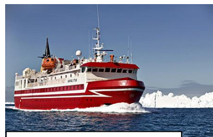
Skibet fra Ilulissat til Sisimiut