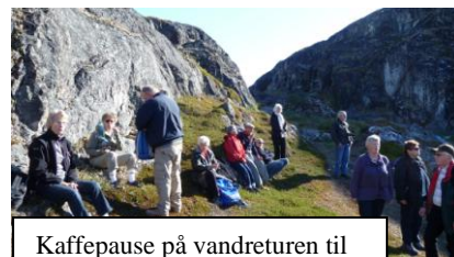
Kaffepause på vandreturen til Sermermiut i Ilulissat